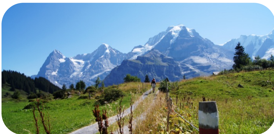
Blick auf Eiger, Mönch und Jungfrau